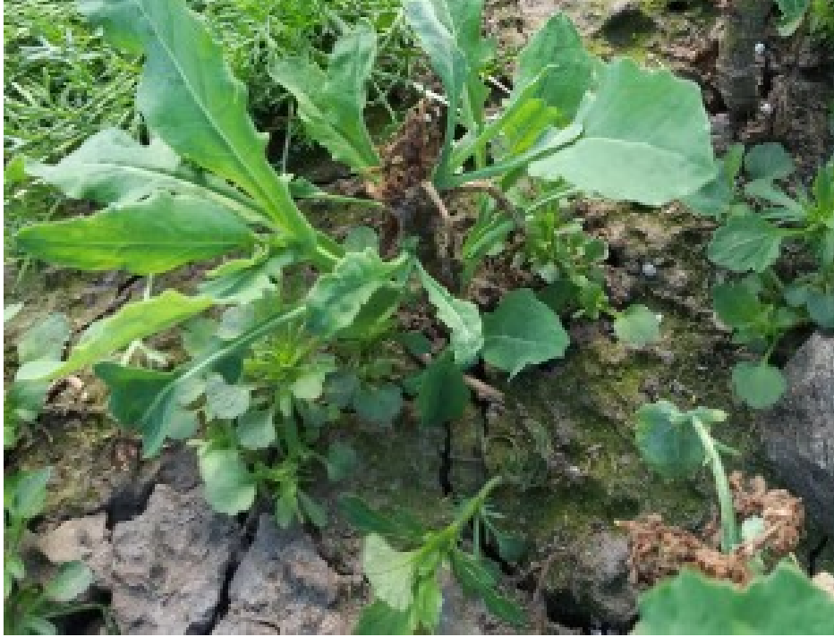
Billede 1. Nærbillede af angreb. Når planten flækkes og er „levende“ af rapsjordloppelarver, er man ikke i tvivl om årsagen til den dårlige vækst.