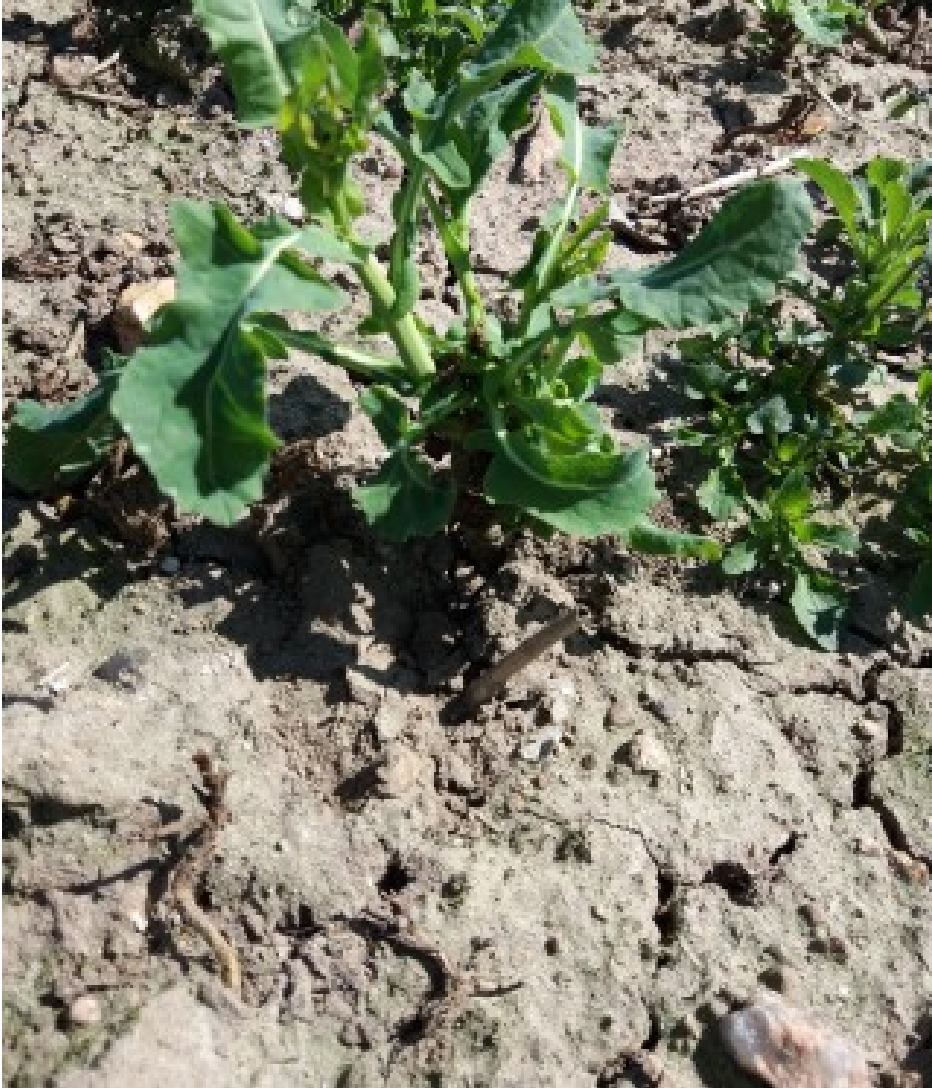
Billede 3. Angreb af rapsjordloppelarver.