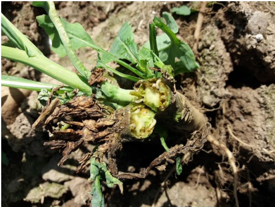
Billede 2. Der ses mange larver af rapsjordlopper.