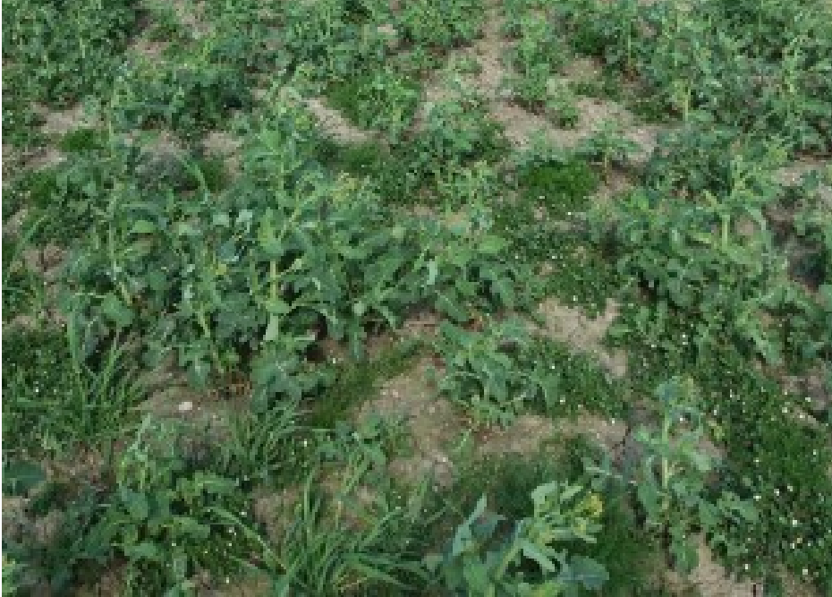
Billede 4. Den angrebne mark på afstand. I de "gode" planter findes i de fleste tilfælde også mange larver, når stængler og bladstilke flækkes.